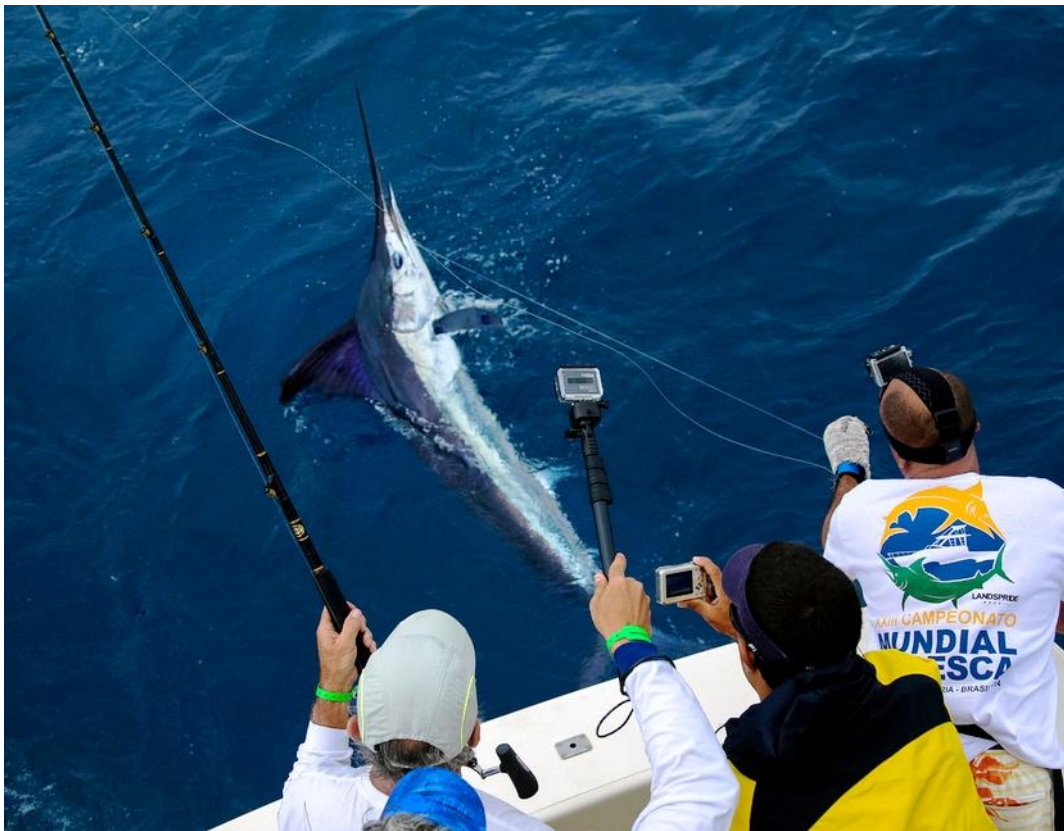
Drei Kamera-Männer und 1 Angler: Ohne korrekte Dokumentation des gesamten Handlings kein Fisch!

Es stellte sich also heraus, dass der Teamkollege an der Videokamera mindestens so wichtig war wie der Angler, der im Drill stand; machte einer von beiden einen Fehler zählte der Fang nicht. Aber auch Schnurstärke, Schnurlänge und Haken wurden intensiv nach der Rückkehr der Boote im Hafen überprüft, und auch dies führte bei manchen Teams zu Überraschungen. Interessanterweise vielen dabei Teams aus Länder wie Spanien, Italien und Ägypten aber auch Österreich auf; ein Schelm der Böses dabei denkt.